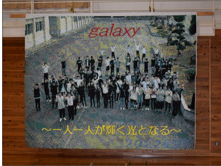
全校生徒で作ったモザイクアート

初めての星河祭で、高校初のステージ発表で少し緊張したけれど、皆が楽しめるステージ発表になり、いい思い出になりました。