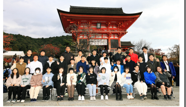
秋田県立横手高等学校 定時制 令和4年度修学旅行記念 11月16日 清水寺にて

二年次生による修学旅行が十一月十六日(水)〜十九日(土)にかけて行われた。初めて関西方面へ赴いた生徒も多いだろう。京都、奈良、大阪の三県を訪れ、たくさんの思い出を作ることができたようだ。