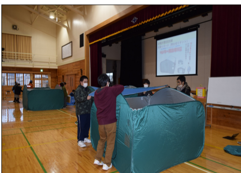
テント設営の様子

十二月九日(金)に冬季防災訓練、避難所開設訓練が行われた。 前回の防災訓練の時よりも、迅速に避難ができていたと教頭先生から講評を頂くことができた。 今回は横手市危機対策課の方々に来ていただき、実際にテントや簡易トイレ、ベッドの設営を体育館で行った。